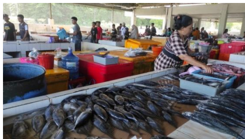
Gambar 1.1 Data Lokasi TPI UPT Pondokdadap

“sebelum adanya wabah pandemic covid-19 penjualan ikan disini terbilang cukup ramai setiap parawisatawan local maupun non lokal akan mampir ke tempat pelelang ikan ini, namun setelah wabah pandemic covid-19 meluas dan adanya kebijakan dari pemerintah parawistawan menjadi berkurang untuk berkunjung ke tempat pelelangan ikan”.