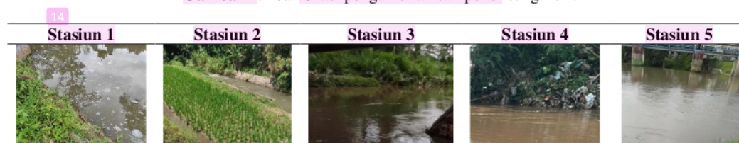
Gambar 2. Profil fisik lokasi pengambilan sampel tiap stasiun pengamatan