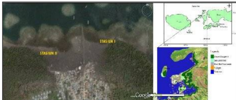
Gambar 1. Peta lokasi penelitian pada ekosistem Hutan Mangrove Pantai Wael-Teluk Kotania, Kabupaten Seram Bagian Barat.

Secara geografis Hutan mangrove letak Perairan Pantai Wael yang dijadikan sebagai lokasi penelitian adalah : Stasiun I terletak pada posisi 03 o 04' 04.10" LS dan 128 o 05' 28.36" BT. Stasiun II terletak pada posisi 03 o 04' 04.77" LS dan 128 o 05' 12.86" BT (Gambar 1)