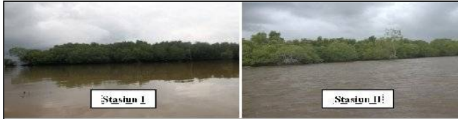
Gambar 2. Lokasi Pengambilan Sampel dengan keragaman dan kerapatan mangrove yang berbeda

Ekosistem hutan mangrove Wael-Teluk Kotania Kabupaten Seram Bagian Barat memiliki potensi hutan mangrove yang cukup tinggi (Gambar 2).