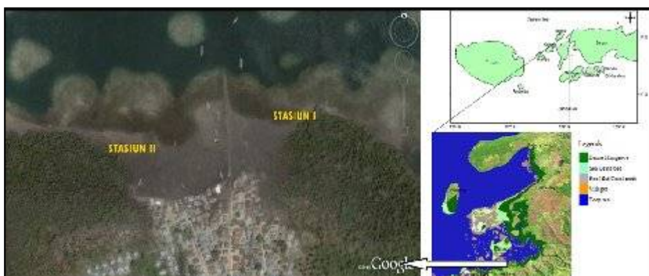
Gambar 1. Peta lokasi penelitian pada ekosistem Hutan Mangrove Pantai Wael-Teluk Kotania, Kabupaten Seram Bagian Barat.

Secara geografis Hutan mangrove letak Perairan Pantai Wael yang dijadikan sebagai lokasi penelitian adalah : Stasiun I terletak pada posisi 03 o 04' 04.10" LS dan 128 o 05' 28.36" BT. Stasiun II terletak pada posisi 03 o 04' 04.77" LS dan 128 o 05' 12.86" BT (Gambar 1)