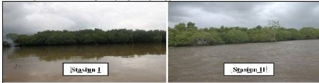
Gambar 2. Lokasi Pengambilan Sampel dengan keragaman dan kerapatan mangrove yang berbeda

Ekosistem hutan mangrove Wael-Teluk Kotania Kabupaten Seram Bagian Barat memiliki potensi hutan mangrove yang cukup tinggi (Gambar 2).