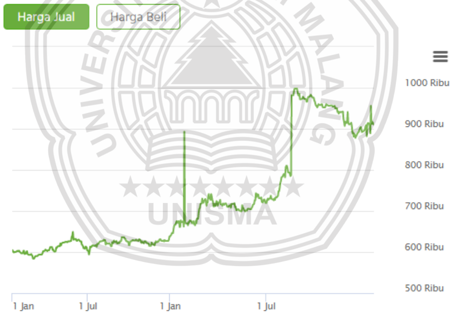
Gambar 1. 1 Grafik Harga Emas Januari 2019-Desember 2020

Menurut Montolalu & Michael (2018) merubah cara saving dan investasi yang aman saat ini dapat berupa investasi tabungan emas di pegadaian. Harga emas yang cenderung meningkat menjadikan tabungan emas sebagai aset investasi yang dinilai cocok untuk jangkauan harga yang terbilang lebih rendah dari aset-aset lainnya.